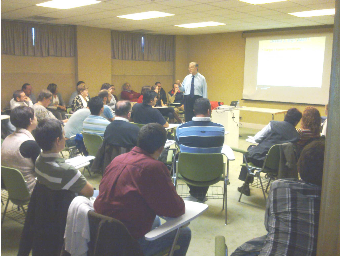
Aula de Seminarios Novacaixagalicia.